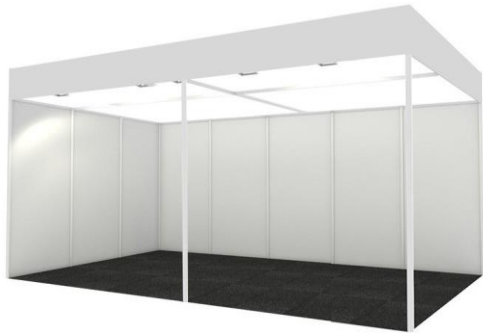
Simulación de estand modular 5x3 sin almacén