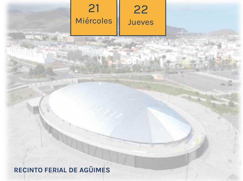
RECINTO FERIAL DE AGÜIMES